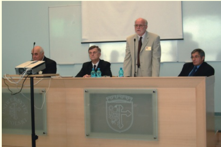
I OFN inaugurują w Auli Błękitnej Collegium Maius Uniwersytetu Opolskiego rektorzy w towarzystwie członków rady programowej