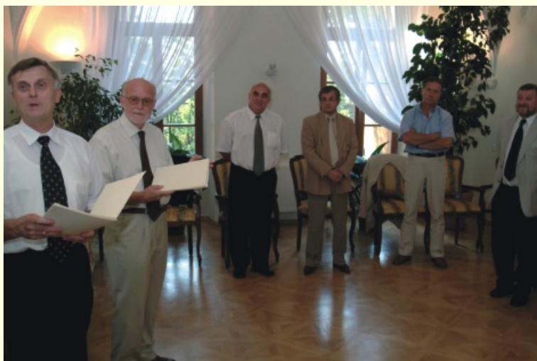
...na koniec uroczyste podsumowanie