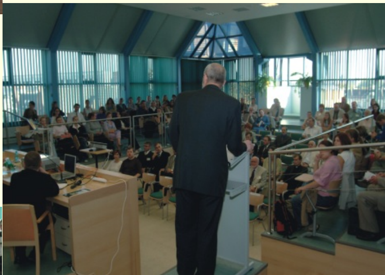
Wśród gości prezydent miasta, wicemarszałek województwa opolskiego, przedstawiciele władz regionalnych i samorządowych, pracownicy nauki, studenci i pierwszy wykład pod prowokującym tytułem, Czy transplantacje to współczesny kanibalizm